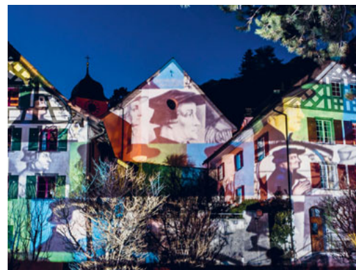
Schattenwurf Zwingli vom 18. Februar 2017 in Weesen.

Aktuelle Informationen finden sie online unter: www.evangel-weesen-amden.ch